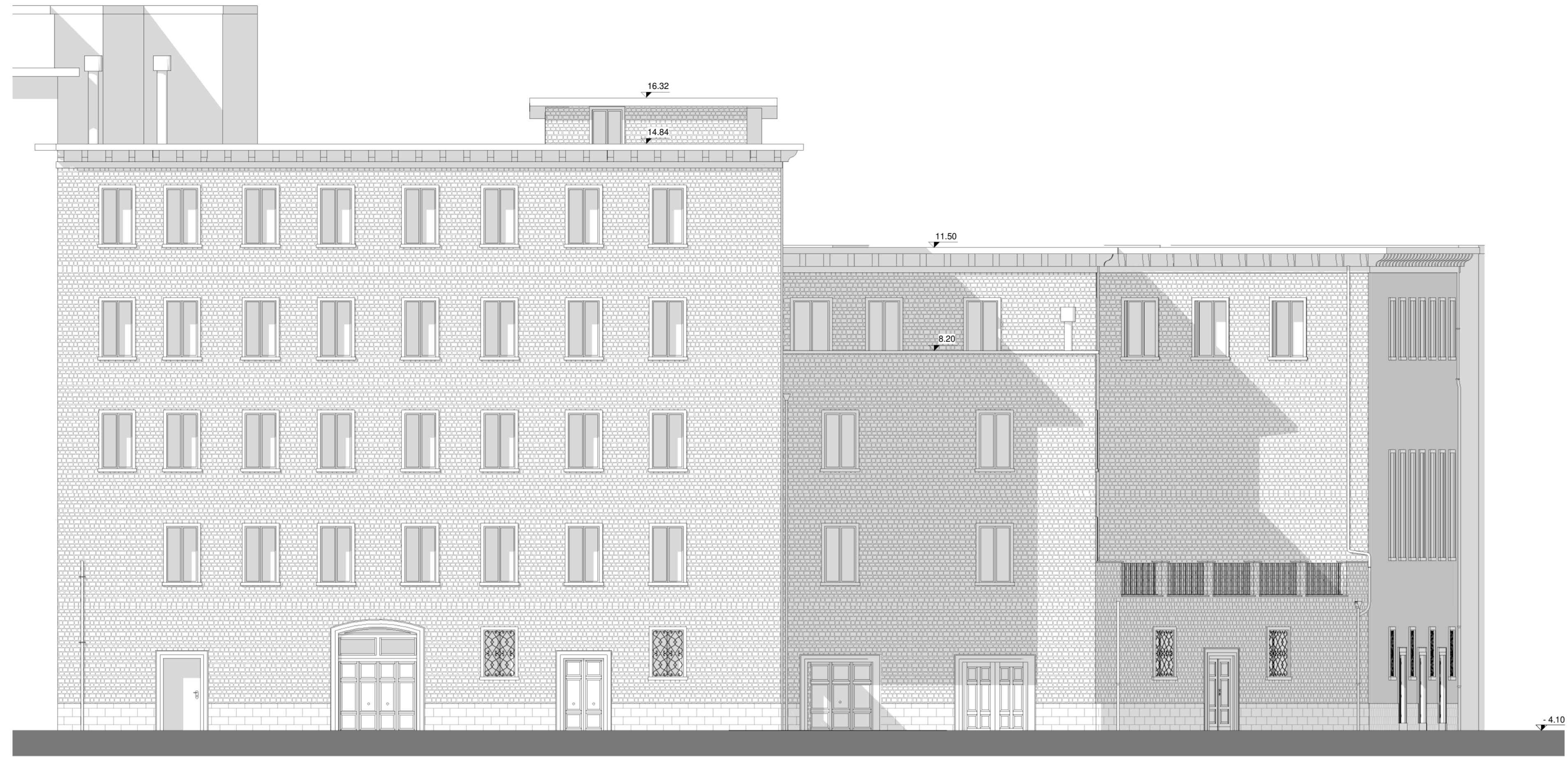
Prospetto Nord-Est (1:100)