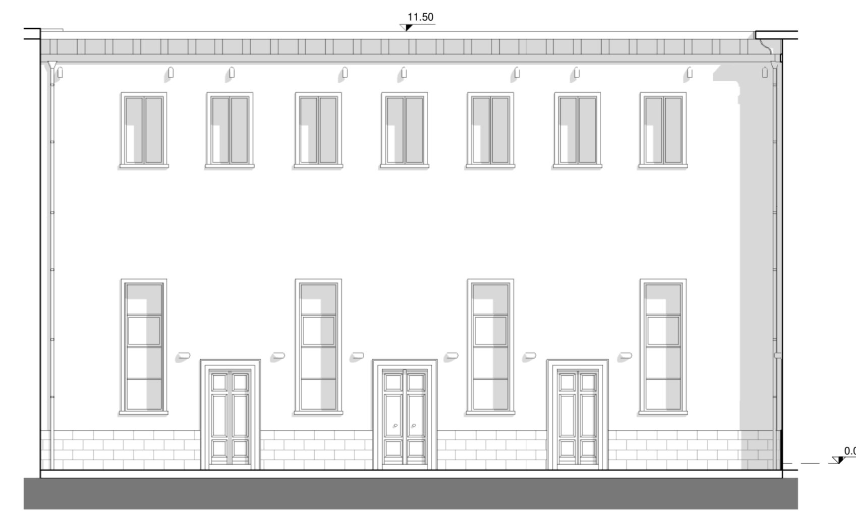
Prospetto Sud-Est (1:100)