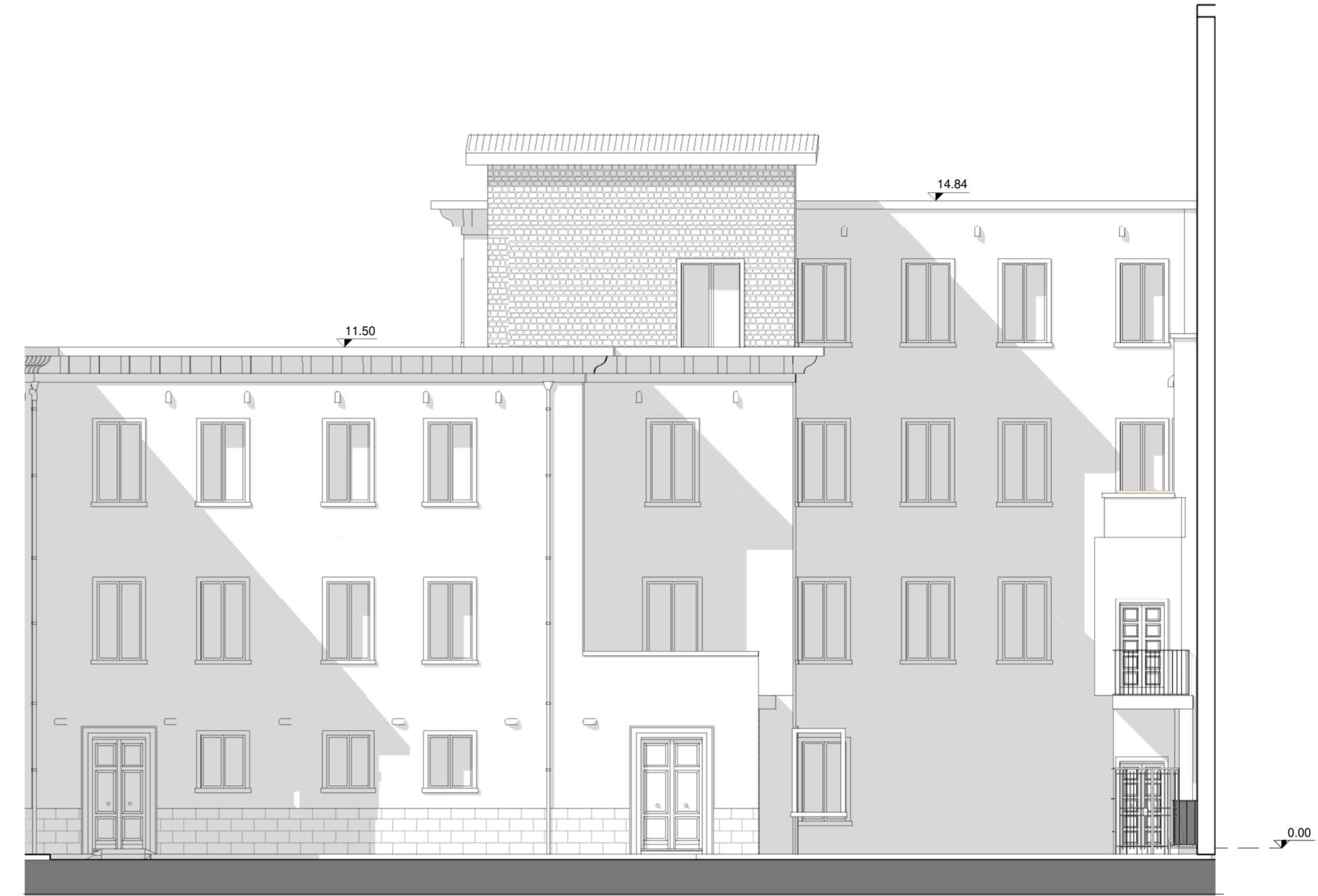
Prospetto Sud-Ovest (1:100)